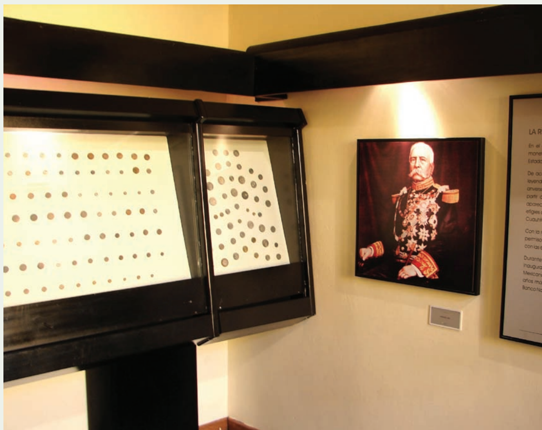
↑ Ukázka z expozice Museo de la Numismática v Toluca.

ce tvoří zlaté ražby Spojených států amerických a Velké Británie. Ražbou alespoň částečně zastupující naše země je uherská zlatá stakoruna.