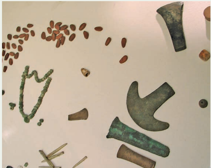
↑ Ukázka premonetárních platidel z prehispanšské éry. Napravo bronzová aztécká platidla mající tvar seker a motyk

Následující sály resp. jednotlivé expoziční vitríny a panely jsou již věnovány konkrétním obdobím premonetárního a monetárního období v chronologickém sledu. Široce jsou zastoupeny především překrásné koloniální ražby, pamatováno je na kontramarkované ražby nebo na městské lokální ražby, jedním z měst, která razila vlastní mince, byla právě i Toluca. Nechybí ani klasické „pirátské“ reály a další zajímavosti. Krátkým, ale pohnutým a významným obdobím, které zcela jistě zaujme našince je období tzv. druhého mexického císařství, jehož ústřední postavou je Maxmilián I. (1832–1867), bratr Františka Josefa I. V roce 1864 byl Maxmilián prohlášen mexickým císařem (za podpory francouzského císaře Napoleona III. a mexických royalistů), nicméně politická nestabilita v zemi