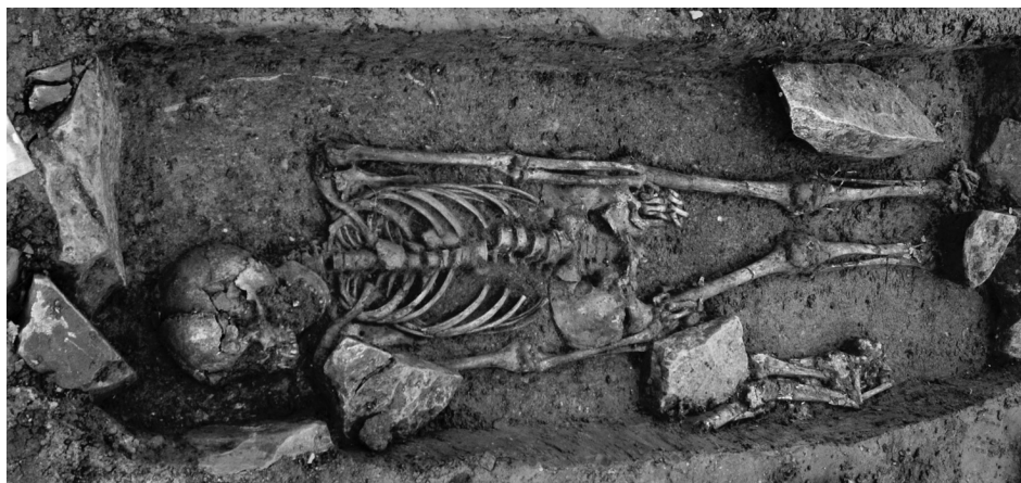
Vypreparovaný objekt č. 128 - hrob č. 35 s kostrou mladé ženy. Do pravé ruky jí byl vložen stříbrný denár „obol mrtvých“

U nás, jak dosvědčují i nálezy z okolních, dříve zkoumaných archeologických lokalit (např. Zeleneč, Nehvizdky, Čelákovice - Kostelní ul. ad.), pro vyšší a střední třídu tehdejší společnosti patří mezi typickou výbavu bronzové, stříbrné či stříbrem, někdy i zlatem plátované záušnice, jednoduché stříbrné či bronzové drobné náušnice, bronzové, někdy i stříbrné prsteny, korále zhotovené z barevného skla, jantaru či křišťálu. Ojedinele se vyskytují i jiné ozdoby, jakou je například u kostry mladé dívky odkryté v hrobě č. 31 nalezená vzácná stříbrná kaptorga, drobná kovová schránka - relikvíář, sloužící k uložení např. nějaké posvěcené částičky. Kaptorgy byly výjimečně nošeny na krku jako součást náhrdelníku. V našem případě byla kaptorga nalezena