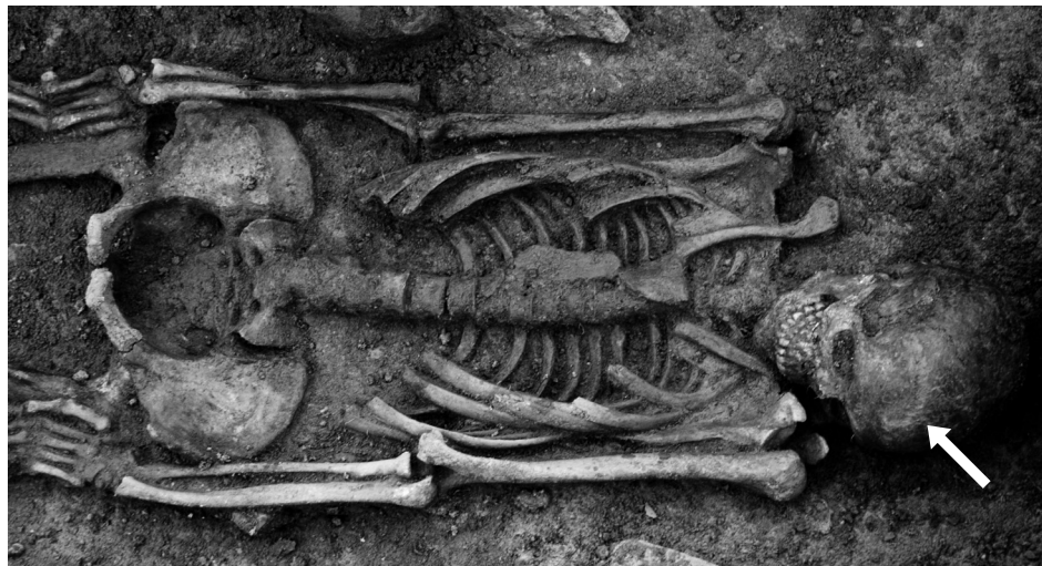
Horní část skeletu uloženého v objektu č. 52 - hrob č. 73. Kostra náleží dospělému muži se zhojenou sečnou ranou na čele

Kdo v tomto oboru nepracuje, těžko si může představit, že takovéto akce vyžadují týmovou práci zkušených odborných a terénních pracovníků, kterými muzeum ve větším počtu logicky nedisponuje a ani je nemůže zaměstnávat v trvalém pracovním poměru. Proto zajistit výzkum na ploše větší než 5 tisíc m 2 , ještě navíc v nepříznivém zimním období, nebylo nijak jednoduchou záležitostí a navíc, jak se ukázalo, byl o to složitější, že se mimo několika výrobních a sídlištních objektů a přes plochu procházející staré cesty patrně na mapách ještě počátkem 20. století převážně jednalo o rozsáhlé kostrové pohřebiště. Preparace hrobů v takovémto terénu je obzvláště časově náročná práce a pracovníci provádějící jejich odkryv musí pracovat jednak velmi opatrně a s citem, a jednak musí znát anatomii kostry, tj. uložení jednotlivých částí skeletu, aby nedošlo k jeho zbytečnému poškození a případně znehodnocení údajů důležitých pro jejich zpracování a interpretaci. Terénní pracovník musí mít také povědomost o tom, ve kterých místech může být uložen průvodní materiál, jakým bývají milodary v podobě nádob, nástrojů, zbraní či jiných předmětů, nebo případně ozdoby či šperky v podobě náhrdelníků sestávajících z většího počtu či z jednotlivých korálků, mnohdy o velikosti pouhých několika milimetrů, náušnice nebo záušnice a další jiné drobné ozdoby. Průběžně s touto velmi náročnou a nesnadno prováděnou preparací jednotlivých skeletů, zde převážně v těžkém jílovitém,