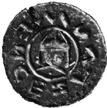
Stříbrný denár Vratislava II. z doby jeho vlády ještě jako českého knížete, nalezený pod rukou mladé ženy v hrobě č. 35

našem území setkáváme s novým typem milodaru v hrobech „oboem mrtvých“ - mincí, která u Slovanů plnila nejspíše zástupnou funkci a ta, vkládaná do úst či později do ruky mrtvého jedince, nesoustřeďovala na sebe u vykonavatelů zákona pozornost a vážnější odpor.