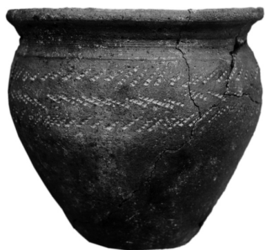
Keramická nádoba nalezená společně se srpem v dětském hrobě č. 51

Pro nejmladší fázi pohřbívání jsou pro naše území všeobecným charakteristickým znakem chybějící milodary - pozůstatky pohanských zvyklostí, vyznačující se předně potravou ukládanou do hrobů v keramických nebo dřevěných nádobách. Úbytek těchto zvyklostí se projevuje vlivem silického křesťanství, významně podpořeným vyhlášením zákonů Břetislavem I. roku 1037, kterými byly tyto přežitky nemilosrdně kárány. S vymizením uvedených zvyklostí se ale na